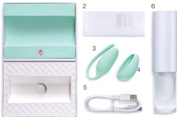
1. Embalaje | 2. Guía de inicio rápido | 3. Monitor de ejercicios de Kegel | 4. Funda opcional para un tamaño personalizado | 5. Cable de conector micro USB | 6. Estuche de cargador inalámbrico